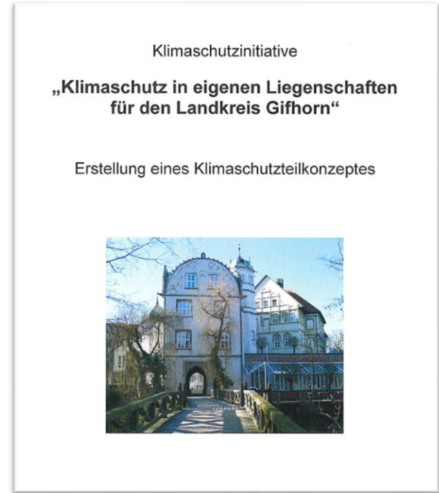
Klimaschutzteilkonzept LK Gifhorn - 31.10.2013

2023 (seit Januar): Offizieller Start der Umsetzungsphase des ESC .