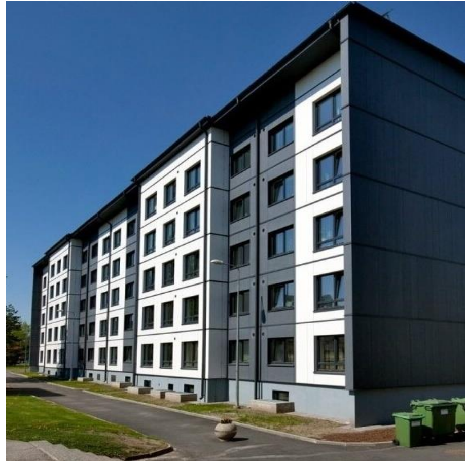
Pilotprojekt serielles Sanieren in Tallinn, 2017; Fassadenelemente von Matek

Seeria Renova kooperiert ebenfalls mit der TTU & TALTECH